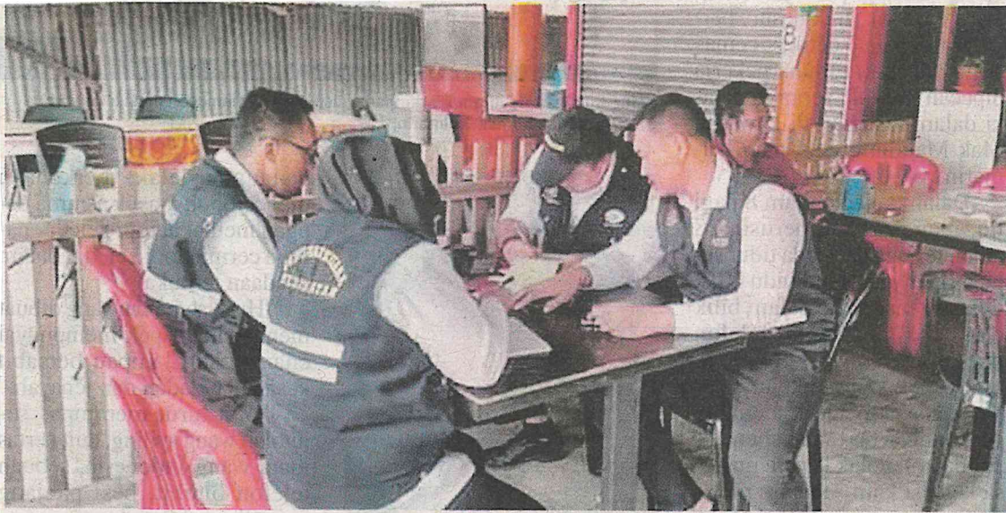
Penguat kuasa Jabatan Kesihatan Negeri Kelantan memeriksa kedai makan di sekitar Kota Bharu semalam.