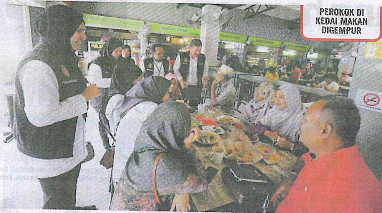
Penguat kuasa Jabatan Kesihatan Negeri Johor melakukan pemeriksaan di kedai makan semalam.